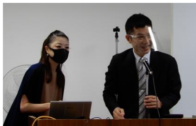
受講生の質問に対応する両講師