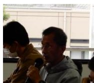
大会開催時の責 任者の賠償責任 割合の質問など