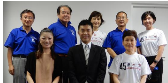
研修会の講師と役員一同