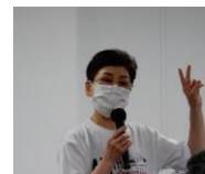
閉会の挨拶と 次回研修会の紹介