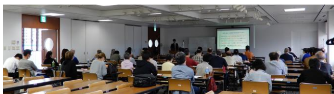
ソーシャルディスタンスを踏まえた研修会風景