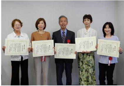
表彰状と記念のウィンドブレーカーを贈呈