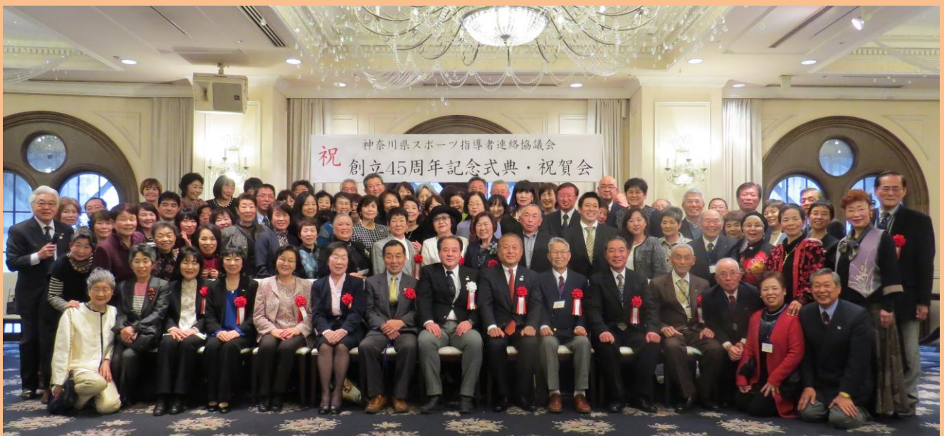
盛り上がった祝賀会後の集合記念写真