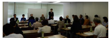
県指導協総会審議風景