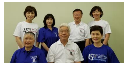
創立45周年記念Tシャツ

今年のラグビーワールドカップ、来年の2020オリンピック・パラリンピック開催と、スポーツに対する関心が高まっています。アスリートは夢と感動、そしてスポーツの素晴らしさを伝える存在です。先日はバレーボール部活動での暴力が発覚しました。皆様方にはスポーツの伝道師として、スポーツの高潔性の保持にご尽力頂き、ご自身の健康にも留意され、今後もご活躍されることをお祈り致します。