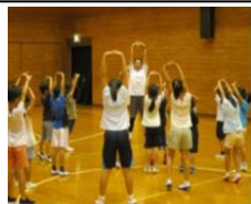
運動前のストレッチ