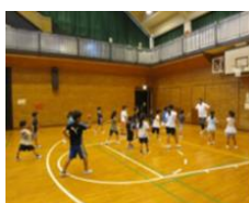
腕振りのチェック