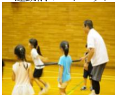
ゴムチューブでもも上げ