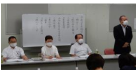
令和4年度総会でのご挨拶

中学校の運動部活動の地域移行に関して、神奈川県ではモデル校15校にて行われています。秦野9校、大磯2校、横浜3校、川崎1校です。市町村によっては対応に温度差があり、まだ取り組んでいない地域もあります。国からは2025年までに土、日の部活動地域完全移行の提案が示されています。先生方と学校、地域で部活動を更に活性化して頂きたいと思えます。是非、ご協力ください。