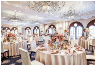
5F会場 ボンヌ・シャンス