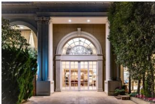
クリスタルホテル正面