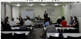
令和5年度総会でのご挨拶

終わりに、会員の皆様 の更なるご活躍と、神奈 川県スポーツ指導者連絡 協議会の益々の発展を 祈念致します。