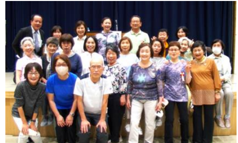
講演後の有志による記念写真