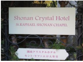
湘南・鎌倉クリスタル