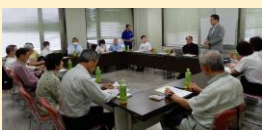
令和6年度総会でのご挨拶

思っておりますので、今後とも力を合わせて取り組んでまいりましょう。最後に会員の皆様のご活躍と神奈川県スポーツ指導者連絡協議会の増々の発展を祈念してご挨拶とさせて頂きます。