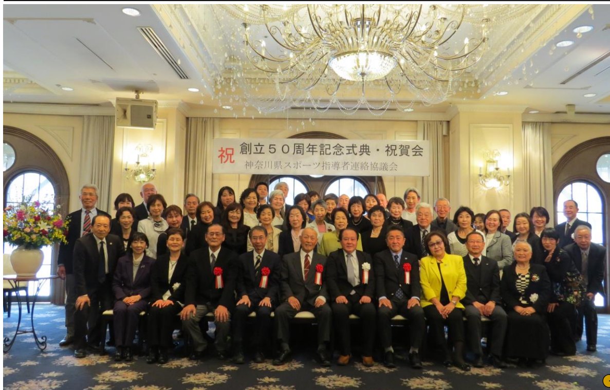
祝 創立50周年記念式典・祝賀会 神奈川県スポーツ指導者連絡協議会